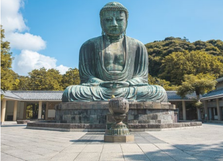
Kamakura / Japón