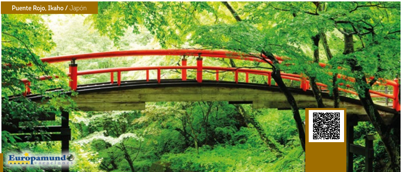
Puente Rojo, Ikaho / Japón

8 Almuerzos o Cenas Incluidos en: Matsuyama, Takamatsu, Monte Koya, Tsumago, Nagano, Ikaho, Tokio, Tokio.