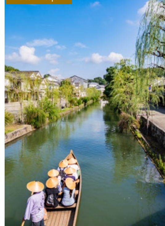
Kurashiki / Japón