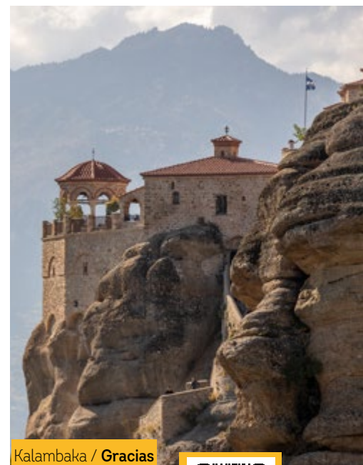
Kalambaka / Gracias

2 Almuerzo o Cena Incluida en: Kalambaka, Nauplia